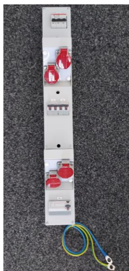
4x T25 16A, 5-pôle