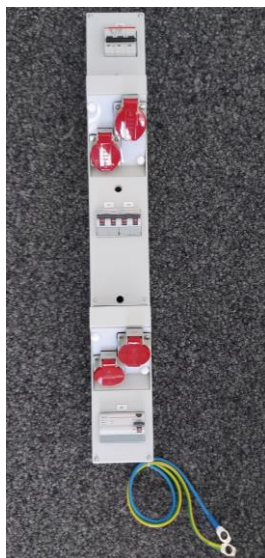
4x T25 16A - 5-polig