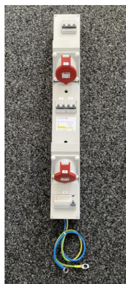
2x CEE 16A, 5-pôle